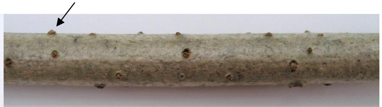
der Schwarze Holunder („Holler“) ( Sambucus nigra ) Blatt unpaarig gefiedert, gegenständig; Strauch; Zweige mit auffallenden Rindenporen (vgl. Bild); im Inneren der Zweige befindet sich ein weiches, weißes Mark (gutes Unterscheidungs-Merkmal gegenüber der Esche)