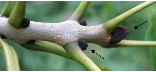
die Gemeine Esche ( Fraxinus excelsior ) Blatt unpaarig gefiedert, bis zu 40 cm lang, 9-13 Blättchen pro Blatt; gegenständig (leicht verschoben); Knospen samtig schwarz, am Zweigende mützenförmig