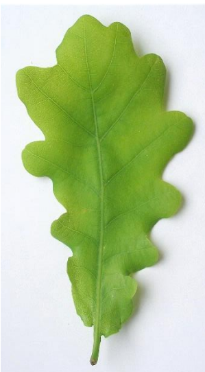
die Eiche ( Quercus ) einfaches Blatt, länglich, gelappt; wechselständig; eiförmige Eichelfrucht im Becher