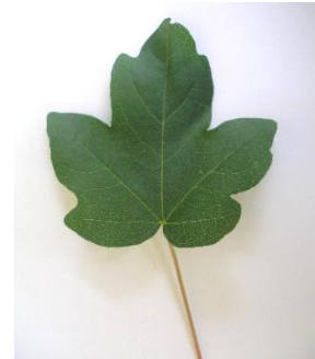
der Feldahorn ( Acer campestre ) 5-lappiges Blatt, glattrandig, kleine Blätter; gegenständig; Flügel der Frucht im 180°-Winkel