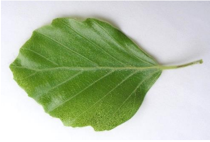
die Rotbuche („Buche“) ( Fagus sylvatica ) einfaches Blatt, glänzend, länglich-eiförmig; ständig; Frucht: Bucheckern; Blattknospen auffallend lang und dünn