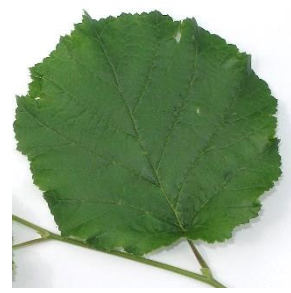
die Hasel ( Corylus avellana ) einfaches Blatt mit leicht gesägtem Rand, kreis- bis eiförmig; wechselständig