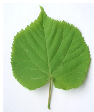
die Linde ( Tilia ) einfaches Blatt mit gesägtem Rand, Blatt herzförmig; wechselständig; Flugfrüchte mit schmaler Tragfläche und kugelige Frucht an einem langen Stiel