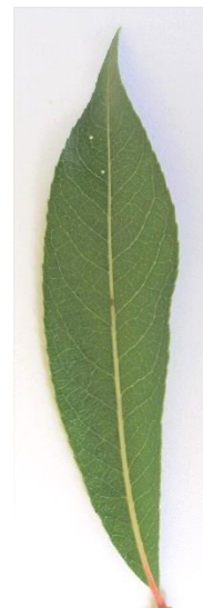
die Salweide ( Salix caprea ) einfaches Blatt, meist lanzettlich, fein gesägt, kurz zugespitzt; wechselständig