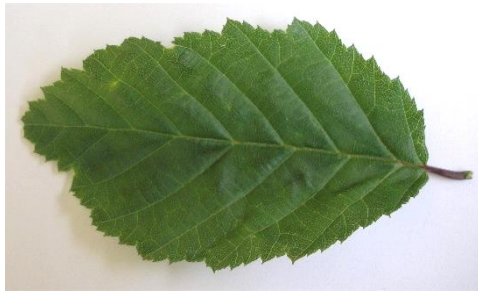
die Hainbuche = Weißbuche ( Carpinus betulus ) einfaches Blatt mit gesägtem Rand, länglich-eiförmig; wechselständig; Flugfrucht mit gelapptem Segel und einem Nüsschen