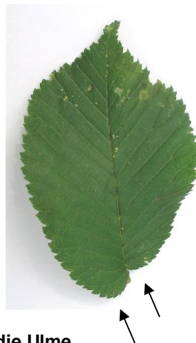
die Ulme ( Ulmus ) einfaches Blatt mit gesägtem Rand, Blatt am Grund unsymmetrisch; wechselständig; Flugfrüchte mit elliptischer Tragfläche und einem Nüsschen in der Mitte