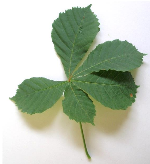
die Rosskastanie ( Aesculus hippocastanum ) Blatt gefingert mit 5-7 Blättchen, doppelt stumpf gezähnt; wechselständig; große braune Samen in stacheliger Hülle