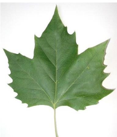
die Platane ( Platanus acerifolia ) einfaches Blatt, meist fünflobig; wechselständig; bei älteren Bäumen springt die Rinde in großen, dünnen Platten ab (gutes Unterscheidungs-Merkmal gegenüber dem Bergahorn)